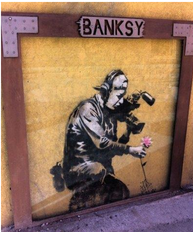
« Banksy mural » par Banksy, Park City, Utah

Le Street art, ou art urbain, est un courant artistique né dans les années 1960-1970 aux Etats-Unis, à la suite de l'apparition de la bombe aérosol. Cette forme d'expression repose sur l'idée que l'artiste plasticien intervient dans l'espace public et sur des supports, publics ou privés, qui ne lui appartiennent pas.