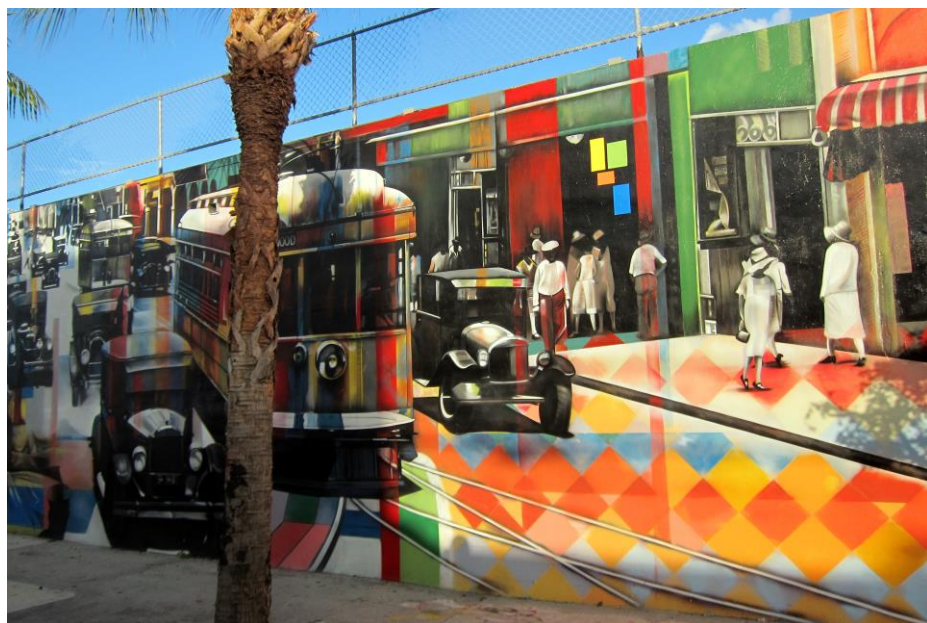
« Mural » par Eduardo Kobra, Wynwood, Miami