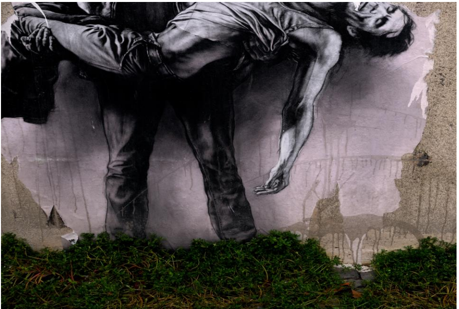
« La Pietà de Pasolini » par Ernest pignon Ernest, Rome