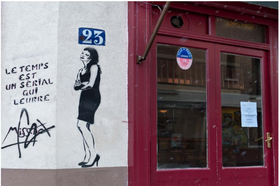
« Le temps est un sérial qui leurre » par MissTic, Paris