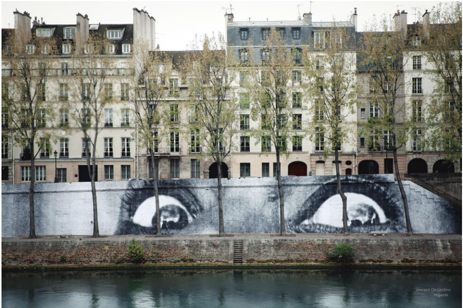
« Women are Heroes » par JR, Paris, île Saint-Louis.