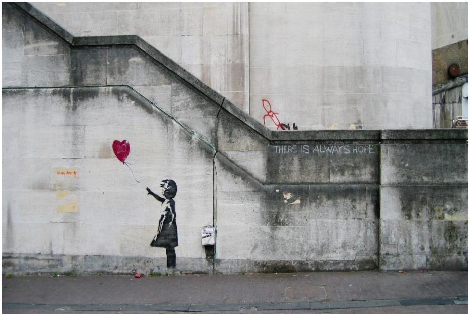
« Banksy Girl and Heart Ballon » par Banksy, Londres