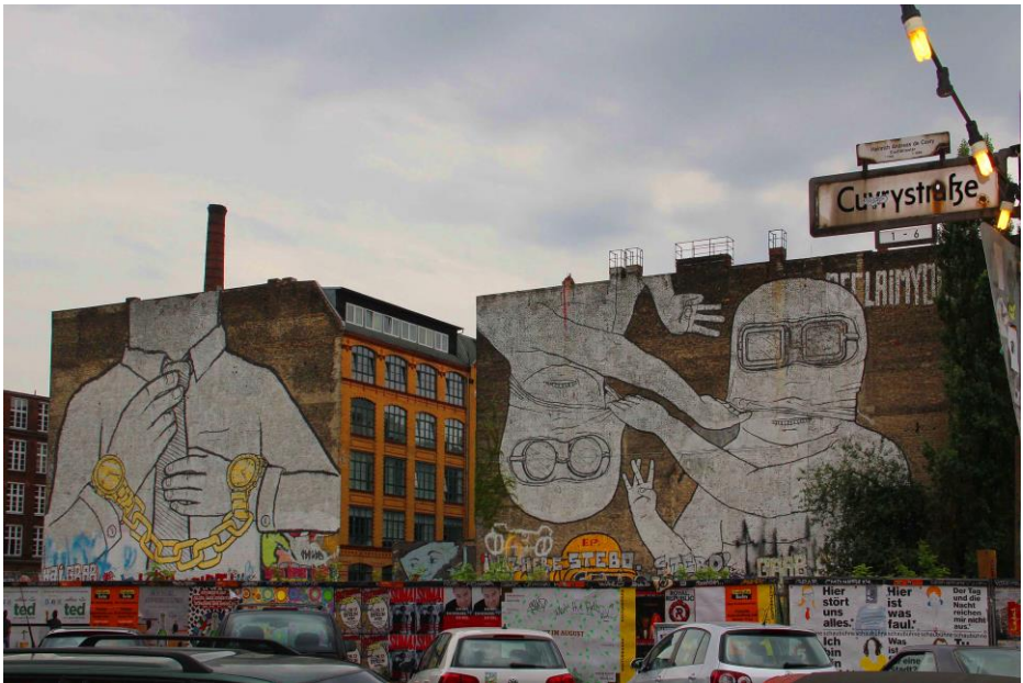
«Handcuffs et East and West » par Blu, Berlin