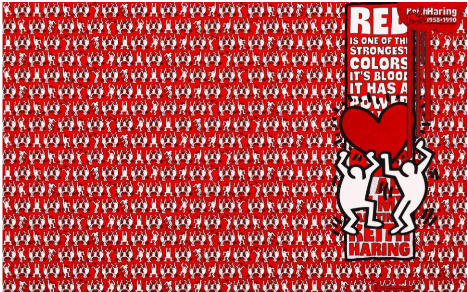
« Thump » hommage a Keith Haring par Typodermic